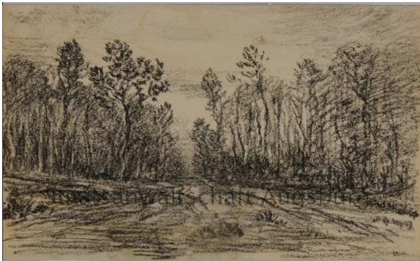
Werk aus dem Nachlass Gurlitt: Théodore Rousseau, Chemin traversant un bois dans la forêt de Fontainebleau (La Chaussée du Roi) , ca. 1850, 162 x 264 mm, Kohle auf Papier