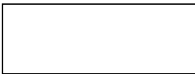
Lugt 2436: authentischer Künstlerstempel

Ein Stempel mit den Initialen Théodroe Rousseaus, der sich auf der Vorderseite des Werkes unten rechts befindet, weicht von den authentischen Markierungen des Rousseau Nachlasses ab (Lugt 2436 und 2437, Abb.). Er ähnelt einem gefälschten Künstlerstempel (Lugt 4272, Abb.), ist jedoch nicht identisch mit diesem. Michel Schulman, Rousseau-Experten und Autor des Catalogue Raisonnés des Künstlers, beschreibt diesen gefälschten Stempel im Werkverzeichnis des Künstlers als „fragwürdigen“ bzw. „falschen“ Stempel. Anstelle eines Punktes, werden die Buchstaben des Vor- und Nachnamens bei diesem womöglich gefälschten Stempel durch eine horizontale Linie getrennt. Schulman gibt zu bedenken, dass einige so gestempelte Zeichnungen zwar durchaus aus der Hand des Künstlers stammen könnten, sie allein anhand des Stempels jedoch nicht mit Sicherheit zugeschrieben werden können.