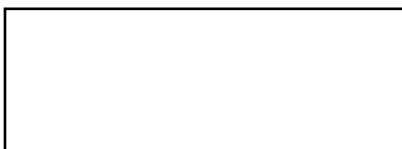
Lugt 4272: gefälschter Künstlerstempel

Eine Anfrage bei Michel Schulman, Autor des Catalogue Raisonné für den Künstler, bezüglich der Zuschreibung sowie Hinweisen zur Provenienz des Werkes in Frage, blieb unbeantwortet.