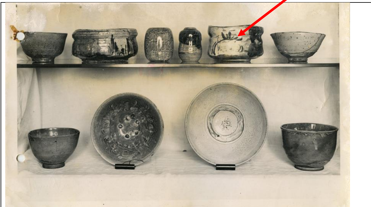
Nachlass Gurlitt: Foto [17.1_F17122_Unbekannt_Keramik_R]