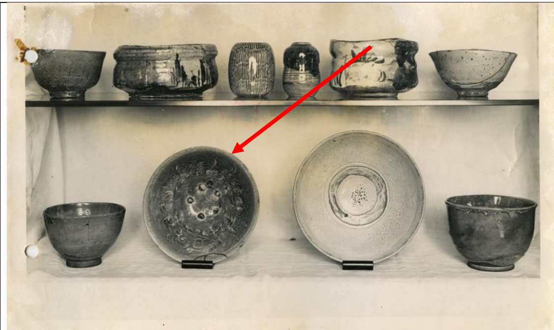
Nachlass Gurlitt: Foto [17.1_F17122_Unbekannt_Keramik_R]