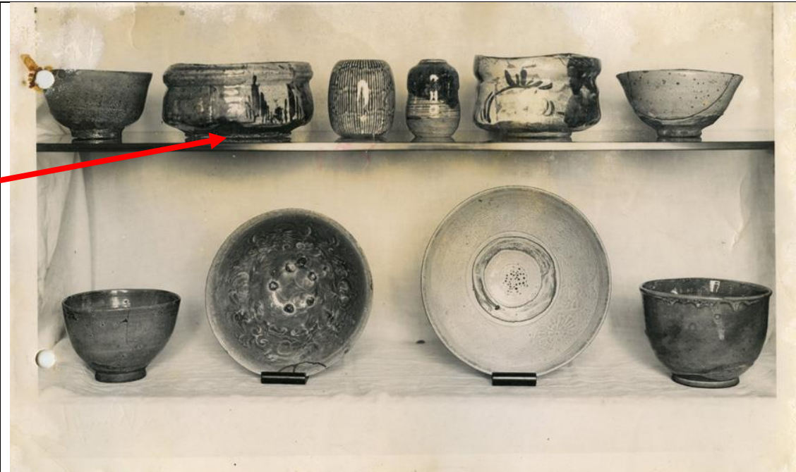
Nachlass Gurlitt: Foto [17.1_F17122_Unbekannt_Keramik_R]