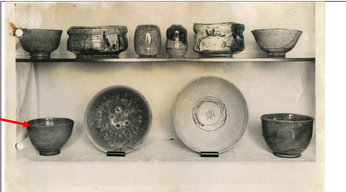
Nachlass Gurlitt: Foto [17.1_F17122_Unbekannt_Keramik_R]